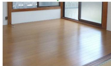
畳からフローリングへ変更