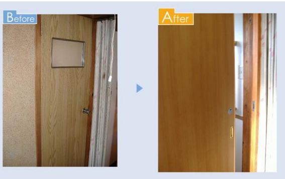
④引き戸などへのドアの取り替え